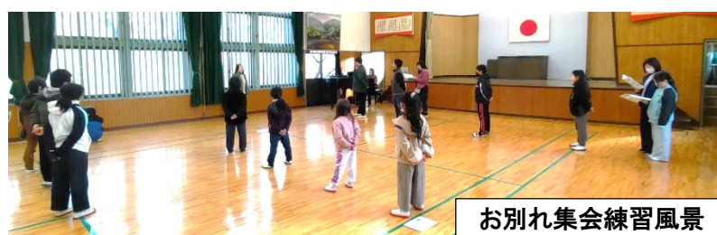
お別れ集会練習風景

熊っ子16人で活動できるのもあと少し、一つ一つのことを大切にしていきながら、色々な活動を通して成長して欲しいと思います。